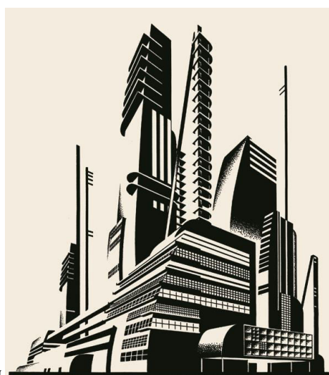
Пример итоговых композиций